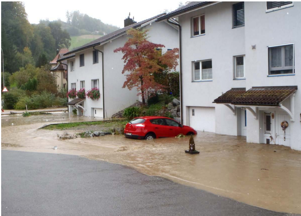
Hochwasser Oktober 2012

Einladung zu einer Informationsveranstaltung über die Gefahrenkarte Hochwasser und Hochwasserschutz an Gebäuden